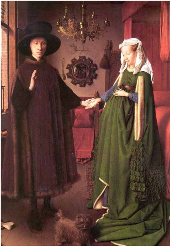
Van Eyc: Coniugi Arnolfin - 1414. Il cagnolino rappresenta la fedeltà coniugale

Nell'arte rinascimentale fu codificato il rimando a contenuti concettuali attraverso il disegno.