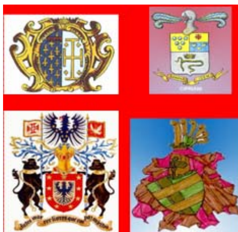
Lo stemma è scelto dal cavaliere che vi riporta "qualche glorioso suo fatto o qualche personale accidente"

Le insegne e gli stemmi rappresentarono nel Medioevo simboli indispensabili di appartenenza