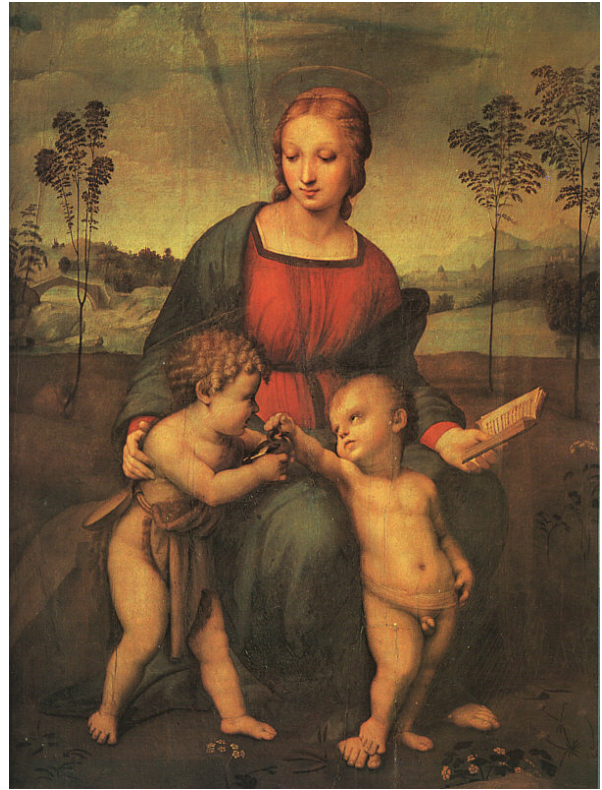
Raffaello Sanzio: Madonna del Cardellino - 1505. Il cardellino indica la passione di Cristo