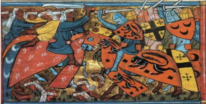
Con lo svilupparsi della scrittura alfabetica gli ideogrammi assumono prevalentemente simboli di identificazione: le insegne per esempio.

Inventato dai Sumeri o forse dagli Egizi, il linguaggio scritto fu all'inizio il disegno.