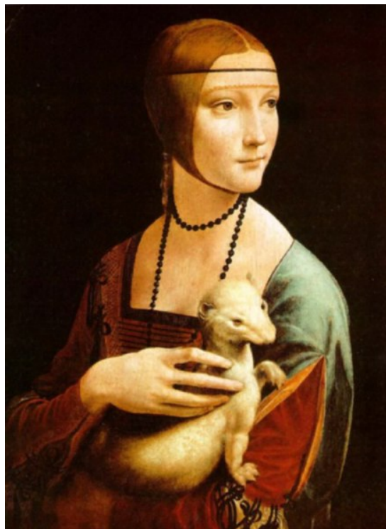
Leonardo Da Vinci: Dama con Ermellino - 1488-90. La radice greca del nome farebbe riferimento al nome di Beatrice Gallerani.